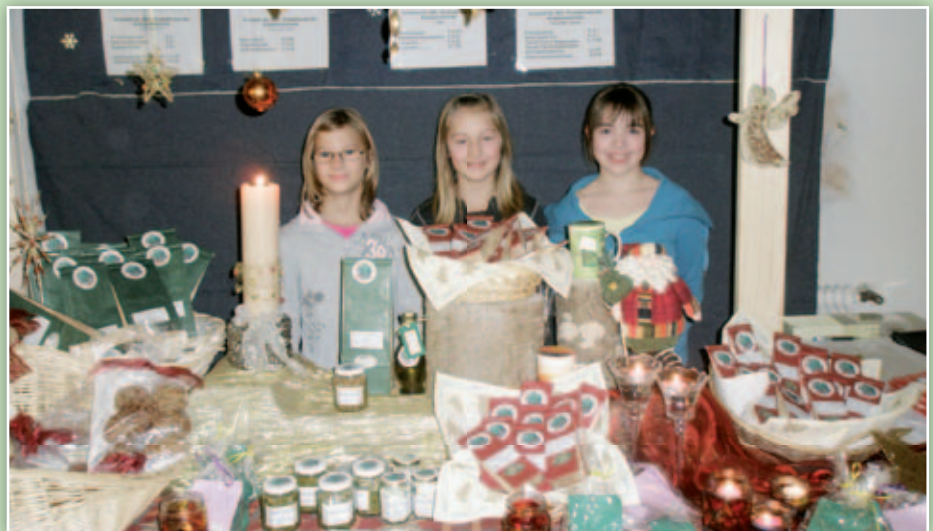
Veredelte Kräuter beim Elternsprechtag in Fügen

gab wichtige Informationen über Getreide und verschiedene Kräuter. Die Betreuerinnen des Projekts können jederzeit mit Hilfe aus dem Lehrkörper und der Unterstützung der Direktoren beider Schulen rechnen. Trotzdem fällt eine gehörige Portion an Mehrarbeit an. Die Freude der Kinder und der einschlagende Erfolg dieses